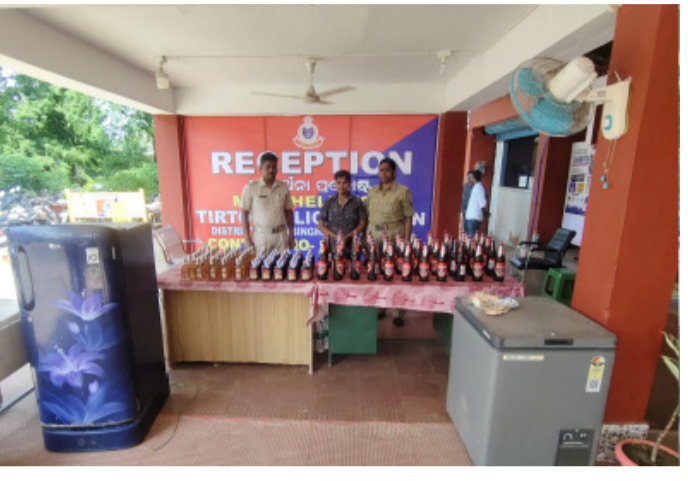
ପରିମାଣର ବିଦେଶୀ ମଦ ଜବତ ହୋଇଥିଲା । ଜବତ ମଦ ମଧ୍ୟରେ ୬୫୦ ଏମଏଲ ୫୩ ବୋତଲ କିଙ୍ଗଫିଶର ଷୁଙ୍ଗ ବିନ୍ଦର, ୧୮୦ ଏମଏଲ ୪୧ ବୋତଲ