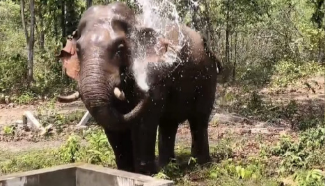
ଆଶ୍ଚର୍ଯ୍ୟ ଓ ଆନନ୍ଦର ସୃଷ୍ଟି କରିଥିଲା । କେହି କେହି ଏହାକୁ ମୋବାଇଲରେ ଫଟୋ ଏବଂ ଭିଡିଓ କରିଥିଲେ । ତେବେ କେହି ସେହି ଦନ୍ତା କୁ କୌଣସି ପ୍ରକାର ହାନୀ ଘଟାଇନଥିବା ବେଳେ କିଛି ସମୟ ପରେ ଦନ୍ତା ପୁଣି ଜଙ୍ଗଲକୁ ଚାଲିଯାଇଥିଲା । ବନ ବିଭାଗ ପକ୍ଷରୁ ଲୋକଙ୍କୁ ସଚେତନ କରାଯାଇଛି ।

ବଗାଇ : ସୁନ୍ଦରଗଡ଼ ଜିଲ୍ଲାର ଗୋପାଳପୁର ଫରେଷ୍ଟ ରେଞ୍ଜ ଅନ୍ତର୍ଗତ କାମଝରିଆ ଗାଁରେ ଏକ ମନୋରମ ଦୃଶ୍ୟ ଦେଖିବାକୁ ମିଳିଥିଲା । ଅସହ୍ୟ ଗ୍ରୀଷ୍ମ ତାପିତ୍ରୁ ଗ୍ରାହୀତା ପାଇଁ ଜଙ୍ଗଲ ଛାଡ଼ି ଗାଁ ନିକଟକୁ ଆସିଥିବା ଏକ ଦନ୍ତା ହାତୀ ନିର୍ମାଣ କାର୍ଯ୍ୟ ପାଇଁ କରାଯାଇଥିବା ଏକ ପାଣି କୁଣ୍ଡରେ ଗାଧୋଇ ନିଜକୁ ଶିତଳ କରୁଥିବା ଦେଖାଯାଇଛି । ସ୍ଥାନୀୟ ଲୋକଙ୍କ କହିବା ଅନୁସାରେ, ଏହି ଦନ୍ତା ଜିଲ୍ଲା ସମୟ ଧରି ଜଙ୍ଗଲ ଅଞ୍ଚଳରେ ଘୁରିବା ପରେ ତାପମାତ୍ରା ବଢ଼ିବାରୁ ଗାଁ ମୁହାଁ ହୋଇଥିଲା । ତେବେ ଗାଁ ମୁଖ ଜଙ୍ଗଲ ନିକଟର ଏକ ଫାର୍ମ ତିଆରି ପାଇଁ ତାର ବାଡ଼ ଦିଆଯାଇଛି । ସେଠାରେ ରହିଥିବା ଏହି ପାଣି କୁଣ୍ଡ ତାହାର ପାଇଁ ଏକ ସୁଯୋଗ ସୃଷ୍ଟି କରିଥିଲା । ଯେଉଁଠାରେ ସେ ଦୀର୍ଘ ସମୟ ଧରି ଗାଧୋଇ ଆରାମ କରୁଥିଲା । ଏହି ଦୃଶ୍ୟ ଗ୍ରାମବାସୀଙ୍କ ମଧ୍ୟରେ ଆଶ୍ଚର୍ଯ୍ୟ ଓ ଆନନ୍ଦର ସୃଷ୍ଟି କରିଥିଲା । କେହି କେହି ଏହାକୁ ମୋବାଇଲରେ ଫଟୋ ଏବଂ ଭିଡିଓ କରିଥିଲେ । ତେବେ କେହି ସେହି ଦନ୍ତା କୁ କୌଣସି ପ୍ରକାର ହାନୀ ଘଟାଇନଥିବା ବେଳେ କିଛି ସମୟ ପରେ ଦନ୍ତା ପୁଣି ଜଙ୍ଗଲକୁ ଚାଲିଯାଇଥିଲା । ବନ ବିଭାଗ ପକ୍ଷରୁ ଲୋକଙ୍କୁ ସଚେତନ କରାଯାଇଛି ଯେ, ଏପରି ସମୟରେ ହାତୀକୁ ବିଚଳିତ ନକରି ସୁରକ୍ଷିତ ଦୂରତା ରଖିବା ଆବଶ୍ୟକ । ଅନ୍ୟପକ୍ଷରେ ଜଙ୍ଗଲରେ ପାଣି ସଂରକ୍ଷଣର ଆବଶ୍ୟକତାକୁ ମଧ୍ୟ ଉଚ୍ଚାଗର କରିଛି ଏହି ଦୃଶ୍ୟ । ବନ ବିଭାଗ ପକ୍ଷରୁ ହାତୀର ଗତିବିଧି ଉପରେ ବିଭାଗ ପକ୍ଷରୁ ଲୋକଙ୍କୁ ସଚେତନ କରାଯାଇଛି ।