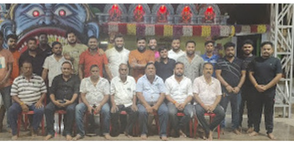
ମୁକାବିଲା କରିବା ପାଇଁ ସ୍ଥାନୀୟ ହସିଦାଲ ସହଯୋଗରେ ଏକ ଆୟୁର୍ଯ୍ୟାନ୍ତ୍ର ଏବଂ ଓଡ଼ିଶା ଅଗ୍ନିଶମ ବାହିନୀର ଏକ ପାଠ୍ୟାୟ ଟିମ୍ ଜରୁରୀକାଳୀନ ସେବା ପାଇଁ ମୁତୟନ କରାଯିବ । ମହୋତ୍ସବରେ ଯୋଗଦେବାକୁ ଆସୁଥିବା ଶ୍ରଦ୍ଧାଳୁ ଓ ସାଧାରଣ ଲୋକଙ୍କ ପାଇଁ ତାରିଦିନ ବ୍ୟାପୀ ନିଶ୍ଚଳ ଖାଦ୍ୟ ଓ ପାନୀୟର ବ୍ୟବସ୍ଥା ମଧ୍ୟ କରାଯାଇଛି । ମହିଳା ଓ ଶିଶୁମାନଙ୍କ ପାଇଁ ଏଥର

ଯାଉଛି । ଚଳିତ ବର୍ଷ ମହୋତ୍ସବର ଅନ୍ୟତମ ଆକର୍ଷଣ ହେବ ୨୦୦ରୁ ଅଧିକ ଛୋଟ ଓ ବଡ଼ ବୋଲି । ରଜ ଉତ୍ସବର ପାରମ୍ପରିକ ରୂପକୁ ଅଧିକ ରଖିବା ପାଇଁ ବୋଲି, ଲୋକସଂସ୍କୃତି ଓ ଗ୍ରାମୀଣ ପରିବେଶକୁ ପ୍ରାଧାନ୍ୟ ଦିଆଯାଇଛି । ଏହି ମହୋତ୍ସବକୁ ଦେଖିବା ପାଇଁ କଟକ ସହର ସହ ବିଭିନ୍ନ ଅଞ୍ଚଳରୁ ବହୁ ସଂଖ୍ୟକ ଲୋକଙ୍କ ସମାଗମ ହେବାର ସମ୍ଭାବନା ଥିବାରୁ ସୁରକ୍ଷା ବ୍ୟବସ୍ଥାକୁ ବିଶେଷ ଗୁରୁତ୍ୱ ଦିଆଯାଇଛି । ଗ୍ରାମର ପ୍ରାୟ ୧୦୦ ଯୁବକ ଓ ଯୁବତୀଙ୍କୁ ନେଇ ଏକ ସ୍ୱେଚ୍ଛାସେବୀ ଟିମ୍ ଗଠନ କରାଯାଇଥିବା ବେଳେ, କଟକ ସଦର ପୋଲିସ୍ ପକ୍ଷରୁ ସମ୍ପୂର୍ଣ୍ଣ ସୁରକ୍ଷା ତଦାରଖ କରାଯିବ । ଏହାସହ ପ୍ରାଚୀନକର ପରିସ୍ଥିତିକୁ