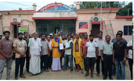
ବେଗୁନିଆପଡ଼ା ଥାନା ଅଧିକାରୀ ଉଦ୍ଧାରଣ ପୂର୍ଣ୍ଣାଙ୍ଗ ନିର୍ଦ୍ଦେଶ କ୍ରମେ ଯୋଗିସ ଟିମ୍ ପହଞ୍ଚି ଶବକୁ ଉଦ୍ଧାର କରି ଯୋଷ୍ଟି ମୋଟର ପାଇଁ ପଠାଇଥିଲେ।