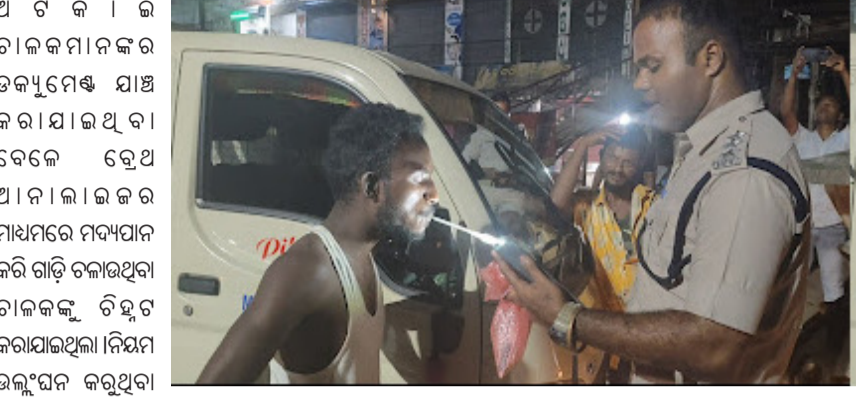
କେଡେକ ଚାଳକଙ୍କ ବିରୋଧରେ ମୋଟର ଭେହିକଲ ଆଇନ ଅନୁଯାୟୀ ଜୋରିମାନା ସହ ଆବଶ୍ୟକ ଆଇନଗୁଣ୍ଡା କାର୍ଯ୍ୟାନୁଷ୍ଠାନ ମଧ୍ୟ ଗ୍ରହଣ କରାଯାଇଥିବା