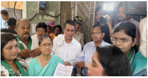
ପାଣିଗ୍ରାହୀ ଓ ବିଭିନ୍ନ ପଞ୍ଚାୟତ ଲୋକ ପ୍ରତିନିଧି ବିଶେଷାଢ଼ପୂର୍ବକ ସହ ବିଭିନ୍ନ ତହସିଲଦାର ବିଶ୍ୱରଂଜନ କହରଙ୍କୁ ରାଷ୍ଟ୍ରପତିଙ୍କ ଉଦ୍ଦେଶ୍ୟରେ ଲିଖିତ ଦାବି ପତ୍ର ପ୍ରଦାନ କରିଥିଲେ । ଦାବି ପତ୍ର ପ୍ରଦାନ ପୂର୍ବରୁ ଉପସ୍ଥିତ ନେତୃତ୍ୱ ବର୍ତ୍ତମାନର ୫୪୩ ସଦସ୍ୟ ବିଶିଷ୍ଟ ଲୋକ ସଭାରେ ଶତକଡା ୩୩% ମହିଳା ସଂରକ୍ଷଣ ରଖିବା ସହ

ବିକିଟୀ, ୨୩।୫ : ମହିଳାଙ୍କୁ ଶତକଡା ୩୩% ସଂରକ୍ଷଣ ରଖିବା ସହ ମହିଳାଙ୍କ ଉପରେ ହେଉଥିବା ଅପରାଧ ନିୟନ୍ତ୍ରଣ ଦାବୀରେ ବିଜୁ ଜନତା ଦଳର ପକ୍ଷରୁ ଏକ ରାଜି ଦାଖଲ କରାଯାଇଛି । ବିଜୁ ଜନତା ଦଳର ପକ୍ଷରୁ ପୂର୍ବତନ ମନ୍ତ୍ରୀ ଉଷା ଦେବୀଙ୍କ ନେତୃତ୍ୱରେ ହଜାର ହଜାର ମହିଳାଙ୍କ ଗଣତନ୍ତ୍ରୀ ଗୋଷ୍ଠୀ ଗଠନ କରିବା ଲାଗି ବିଜୁ ଜନତା ଦଳର ପକ୍ଷରୁ ଏକ ରାଜି ଦାଖଲ କରାଯାଇଛି । ବିଜୁ ଜନତା ଦଳର ପକ୍ଷରୁ ପୂର୍ବତନ ମନ୍ତ୍ରୀ ଉଷା ଦେବୀଙ୍କ ନେତୃତ୍ୱରେ ହଜାର ହଜାର ମହିଳାଙ୍କ ଗଣତନ୍ତ୍ରୀ ଗୋଷ୍ଠୀ ଗଠନ କରିବା ଲାଗି ବିଜୁ ଜନତା ଦଳର ପକ୍ଷରୁ ଏକ ରାଜି ଦାଖଲ କରାଯାଇଛି ।