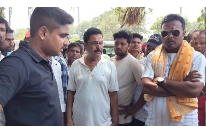
କାର୍ଯ୍ୟାଳୟରେ ତାଳା ପକାଇ ରାଷ୍ଟ୍ରରୋଧ କରି ପ୍ରତିବାଦ କରୁଥିବା ଖବର ପାଇ ଘଟଣା ସ୍ଥଳରେ ଖାରିଆଗୁଡ଼ା ଫାଣ୍ଡି ଅଧିକାରୀ ପହଞ୍ଚି ଲୋକଙ୍କୁ ବୁଝାଇବା ପରେ ଲୋକମାନେ ରାଷ୍ଟ୍ରାନ୍ତ ହଟିଥିଲେ । ଏଥି ସହିତ ବିଦ୍ୟୁତ୍ ବିଭାଗର ଚିକିତ୍ସା ସେକ୍ସନ ଏସଡିଓ ଓ ସୁରଙ୍ଗୀ

ପାତ୍ରପୁର, ୨୩।୫ : ଅଯୋଗ୍ୟ ବିଦ୍ୟୁତ୍ କେନ୍ଦ୍ର କାର୍ଯ୍ୟ ଓ ଏସ୍ ନୁଆର୍ଗା ଗ୍ରାମର ଉପର ପତ୍ରକୁ ଯାଇଥିବା ୧୧ କେଜି ତାର ହତାହତ ଦାବିକୁ ନେଇ ବାରମ୍ବାର ଅଭିଯୋଗ ସତ୍ତ୍ୱେ ନିରବ ଦକ୍ଷା ସାଜିଥିଲା ବିଦ୍ୟୁତ୍ ବିଭାଗ । ତେଣୁ ଏପରି ଚରମ ପଦକ୍ଷେପ ନେବାକୁ ବାଧ୍ୟ ହୋଇ ସୁରଙ୍ଗୀ ବିଦ୍ୟୁତ୍ ଅଫିସରେ ଗ୍ରାମବାସୀ ତାଳା ପକାଇଥିବା କହିଛନ୍ତି । ଗ୍ରାମବାସୀଙ୍କ କହିବା ଅନୁସାରେ ପାତ୍ରପୁର ବ୍ଲକ୍ ଅନ୍ତର୍ଗତ ତାଳପତା ଓ ଆଖପାଖ ଅଞ୍ଚଳର ବୁଲି ଶହରୁ ଉର୍ଦ୍ଧ୍ୱ ଗ୍ରାମବାସୀ ଏକତ୍ରିତ ହୋଇ ସୁରଙ୍ଗୀ ବିଦ୍ୟୁତ୍ କାର୍ଯ୍ୟାଳୟରେ ତାଳା ପକାଇ ପ୍ରତିବାଦ କରିବା ସହିତ ରାଷ୍ଟ୍ର ଅବରୋଧ କରି ସେଠାରେ ରହାବତ୍ କରୁଥିବା ଦେଖିବାକୁ ମିଳିଛି । ବିଦ୍ୟୁତ୍ କାର୍ଯ୍ୟାଳୟ କର୍ମଚାରୀଙ୍କୁ ବାହାରକୁ କାର୍ଡ୍ କ